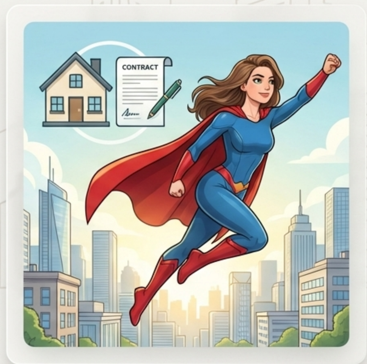
EMPODERAMENTO & FECHAMENTO

O corretor recebe o lead com o histórico completo da conversa.